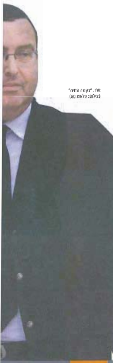
ארז, "קשה הוויה"

איומים והבטחות כי אם יתגוד לו, יקשה עליו ועל מקורביו אליו, ואם יפעל לפי זוראותיו, הדבר "כאב פחות". מפש כשם שאנס אומר לקורבנו כי אם ישתף פעולה, הדבר יכאב פחות.